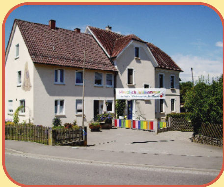
Kindergarten St. Maria Sulmingen

Baltringer Straße 3 88437 Sulmingen Telefon (0 73 56) 25 84 kindergarten.sulmingen@freenet.de