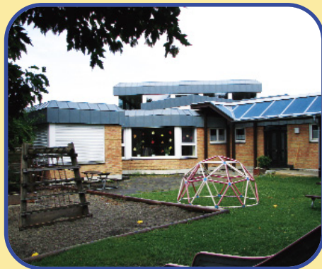
Kindergarten St. Peter und Paul Maselheim

Ellmannsweiler Straße 26 88437 Laupertshausen Telefon (0 73 51) 77 52