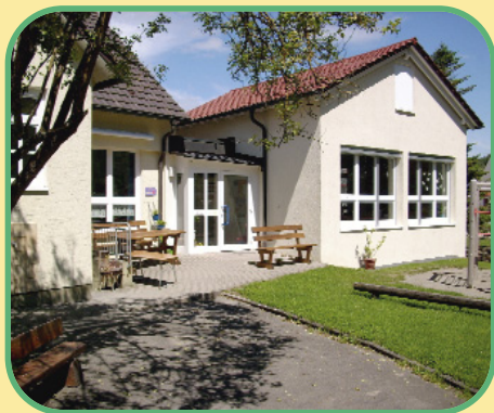
Kindergarten St. Johannes Äpfingen

Laupertshausener Straße 11 88437 Maselheim Telefon (0 73 51) 7 35 24