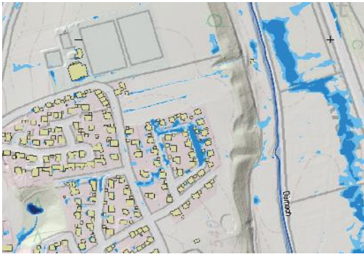
Auszug: Starkregengefahrenkarte, seltenes Ereignis

Die in der Karte ersichtlichen Stauflächen entstehen durch topographische Senken. Ein Zufluss von Außeneinzugsgebieten besteht nicht.